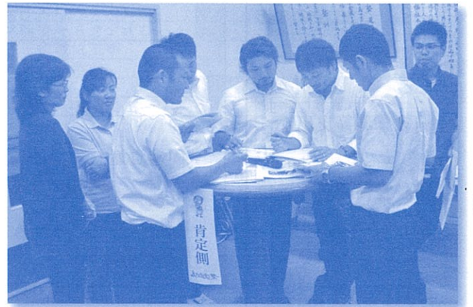
熱いハートで語り合う島マス記念塾生 (島マス記念塾)