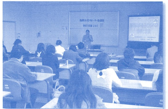
将来の地域福祉の担い手のみなさん! (発達障がい児サポーター養成講座)