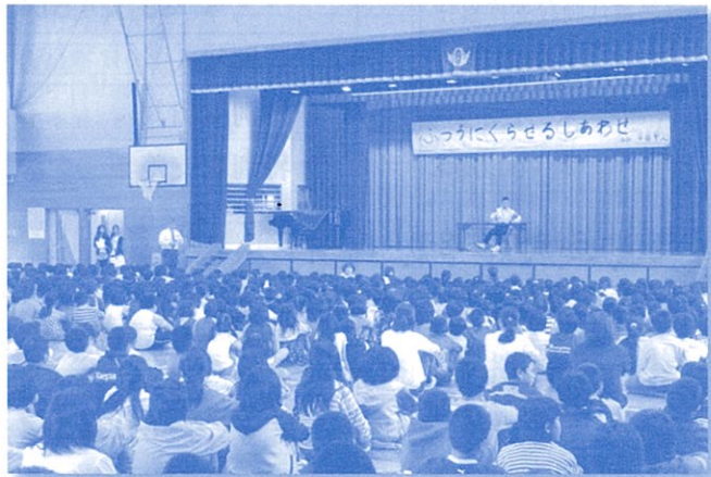
みんなで福祉のお勉強!! 真剣です。(福祉教育推進事業)