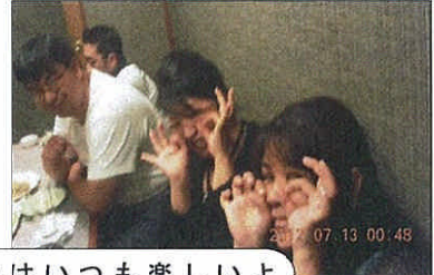
18期19期20期会長揃い踏み！奇跡の3ショット