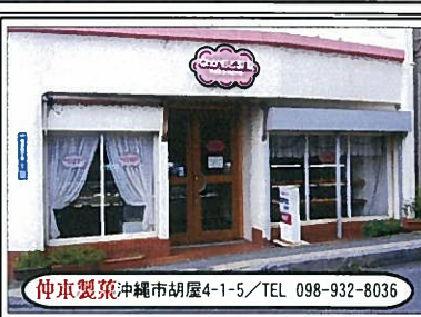
仲東製菓 沖縄市胡屋4-1-5 / TEL 098-932-8036