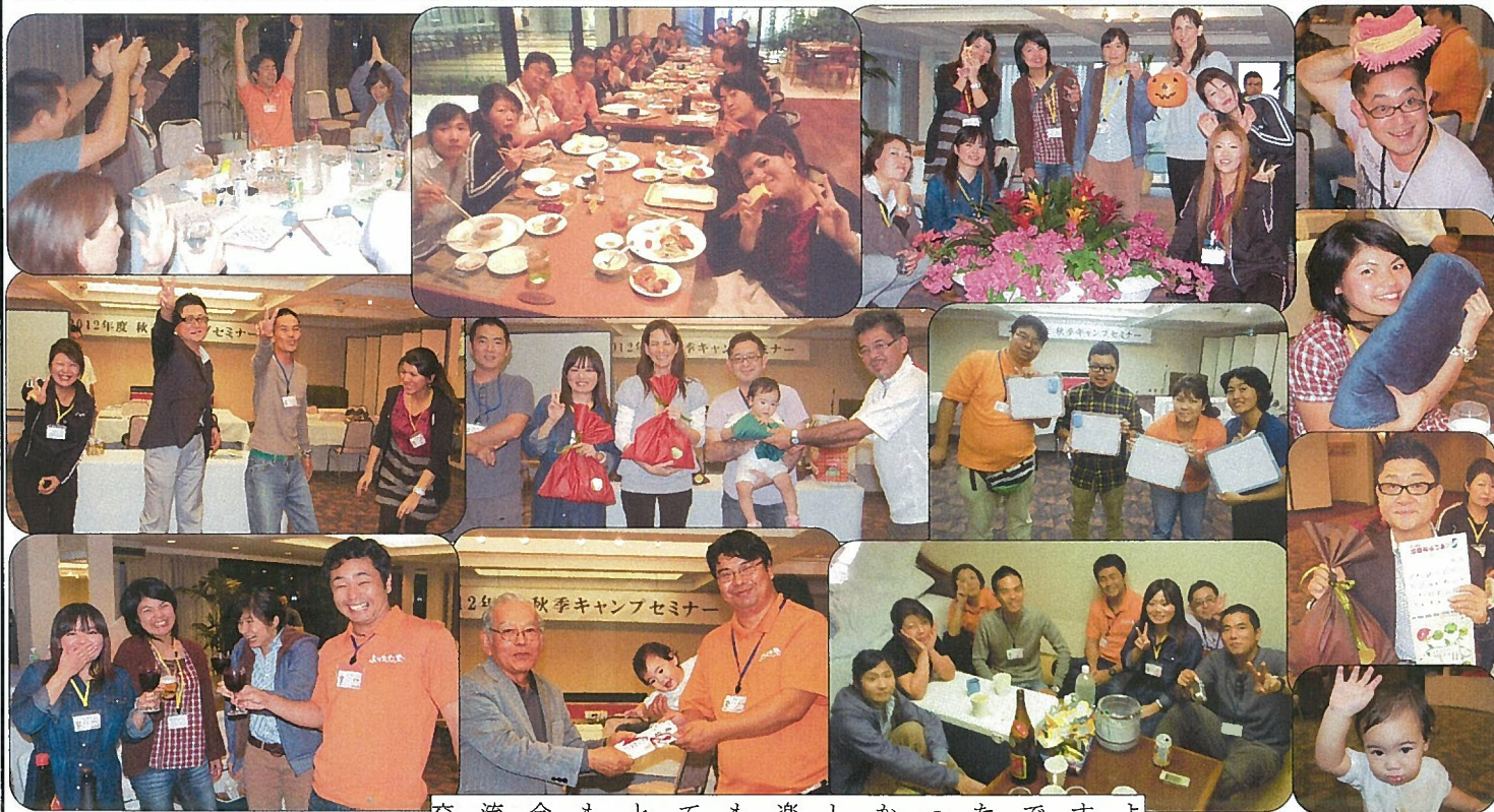
交流会もとても楽しかったですよ