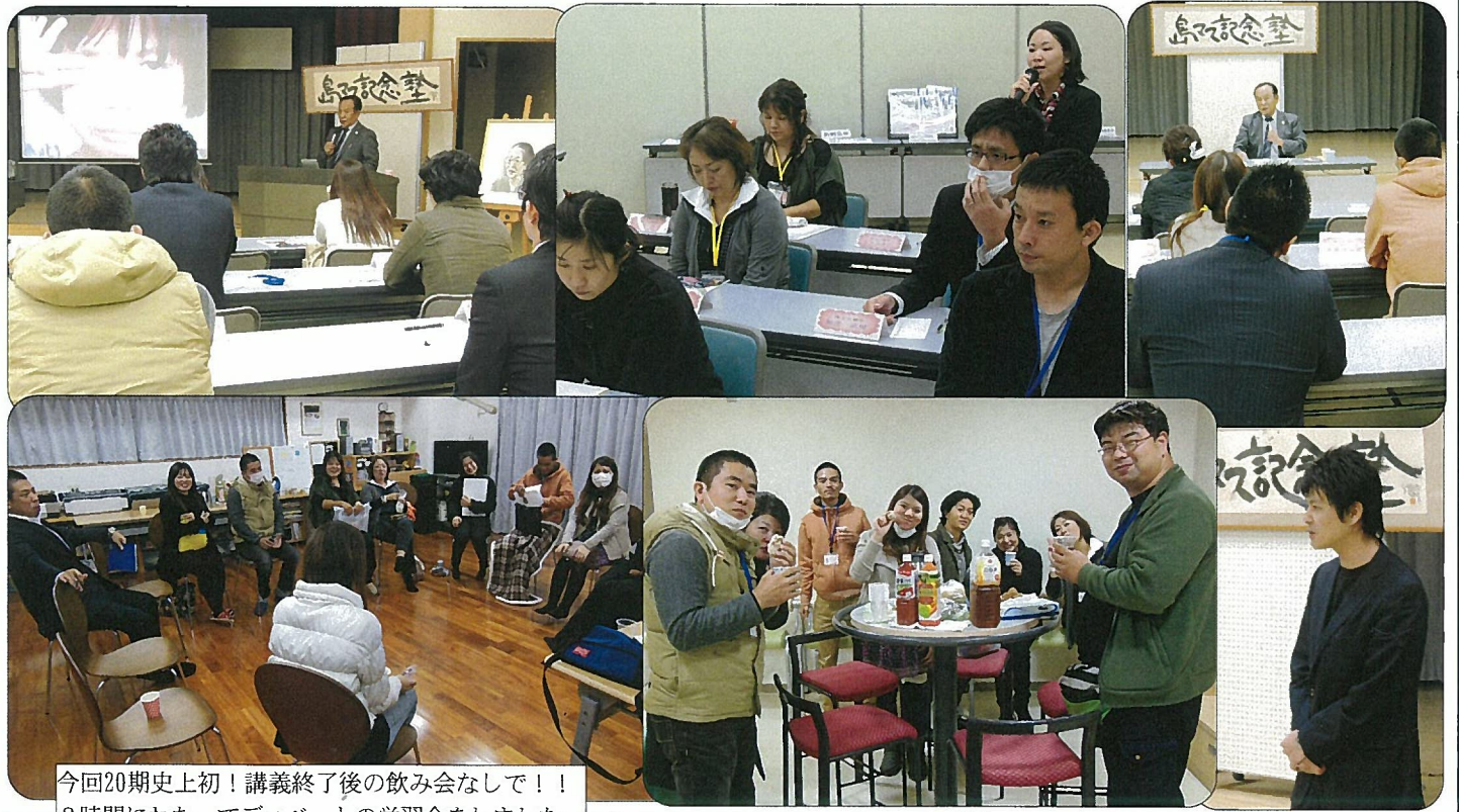
今回20期史上初！講義終了後の飲み会なしで！！2時間にわたってディベートの学習会をしました。