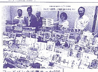
フードバンクで集まった606kgの食料を前に支援を感謝する関係者＝沖縄市住吉、市社会福祉協議会

※土・日・祝日は休館日です。また、寄付は午前10時～12時、午後1時～4時まででお願いします。 ※食料を寄付する方および食料の提供をうける方の個人情報を求めたり、明らかにすることはありません。あらかじめご了承ください。