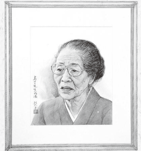
島 マス（與那覇朝大・画）