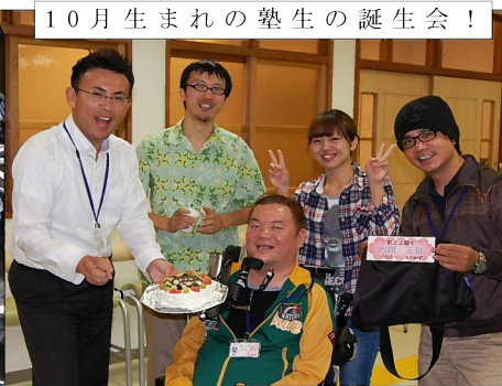
10月生まれの塾生の誕生日会！