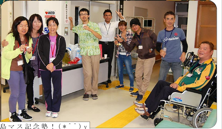
休憩時間も楽しい島マス記念塾！（*^^）v