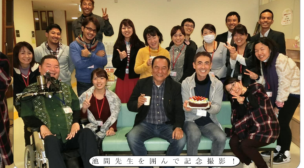
こずえ手作りのバースデーケーキ!