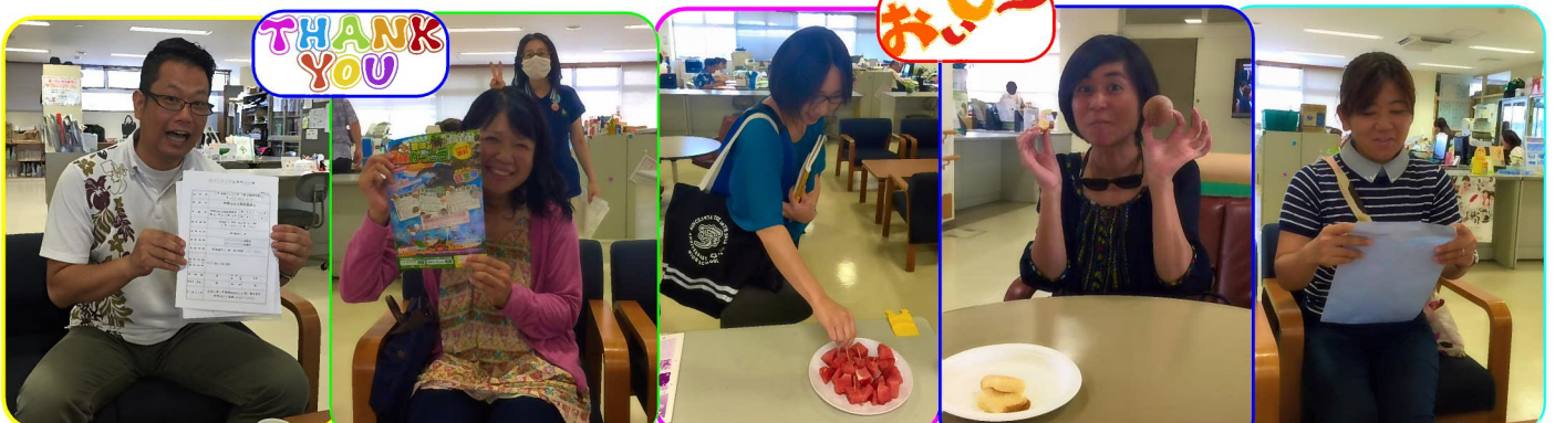
島マス記念塾事務局は、塾生のみなさんが事務所に来てくれるのを待ってマスよー!(*^*)v