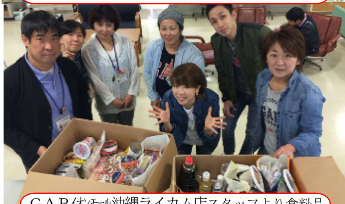
GAPイモール沖縄ライカム店スタッフより食料品

●子どもの貧困問題に関心が高まる中、企業や団体による寄贈品が多数寄せられました。ご協力いただいた皆様！ありがとうございました。