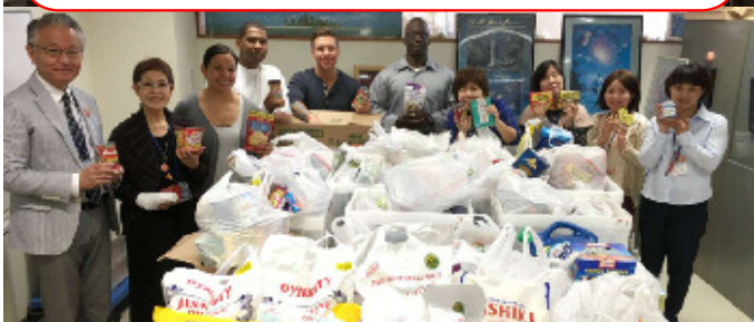
在沖アメリカ軍(嘉手納基地)TOP3より食料品