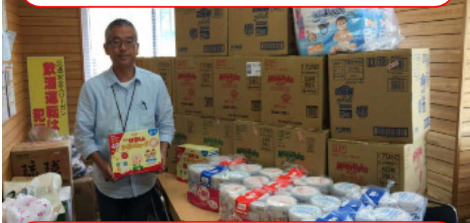
「味自満チェーン」ゴルフコンペより粉ミルクなど