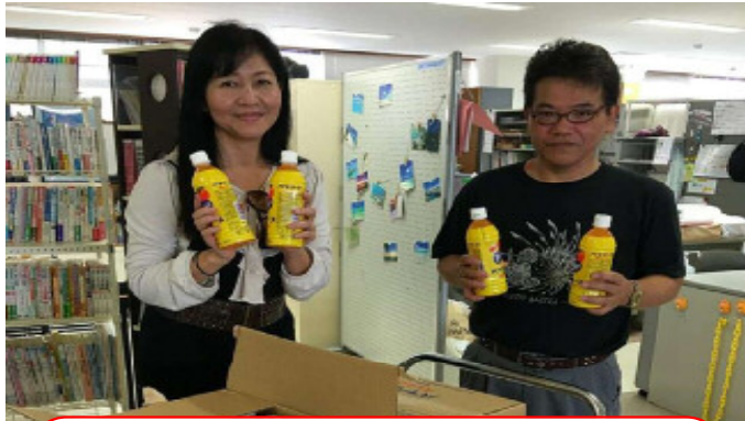
アサヒ・オリオン飲料社よりバヤリース200ケース