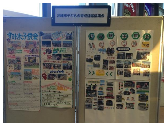
第一回沖縄市子ども支援団体パネル展アンケート感想まとめ