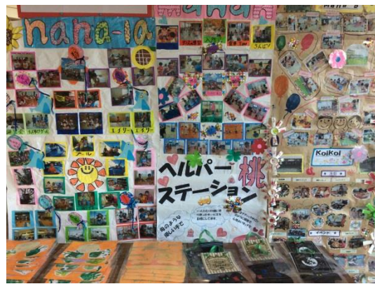
第一回沖縄市子ども支援団体パネル展アンケート感想まとめ