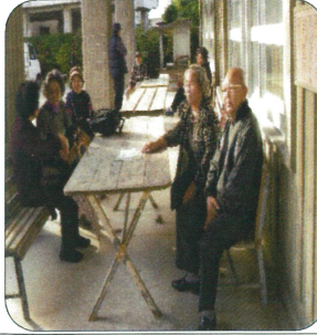
出発前バスを待つ

バスツアーピクニックは2月3日(日)午前9時にかりゆし園の福祉バスで公民館を出発し、26人の皆さんがたんかん狩り、ホテルゆがふいん沖縄の美味しいバイキングを楽しみ、大満足した。オリオンビール工場の「やんばるの森」では新鮮なビールのサービスに話しも盛り上がった。帰りは許田道の駅で買い物を満喫し、家路についた。