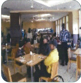
ホテルゆがふいん沖縄で