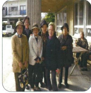
すまし顔でハイポーズ