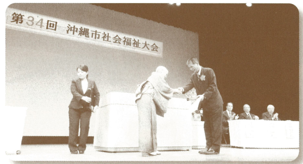
(第34回社会福祉大会)