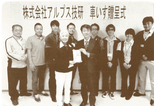
車いす贈呈式 (アルプス技研様より)