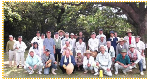
会場設営に参加された区民の皆様(アシビナー)