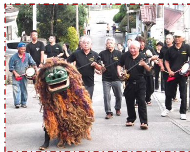
本部落を練り歩く神獅子と三線地謡