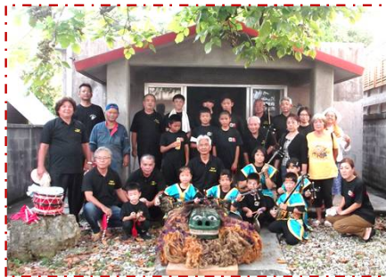
獅子舞奉納演舞前(御神屋)