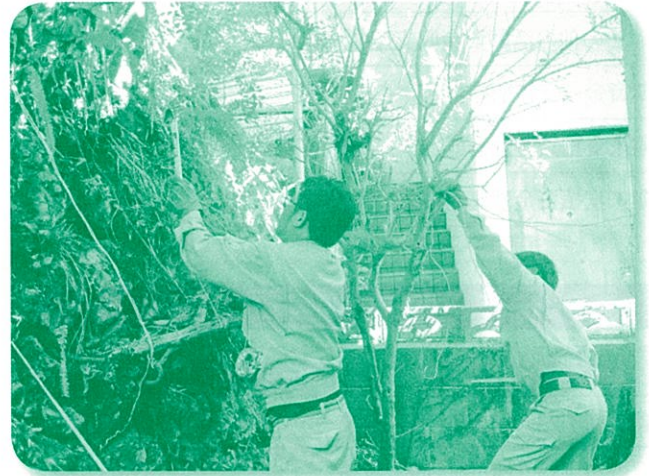
旧盆助け合いおそうじボランティア活動の様子 (市内高齢者や障がい者のご自宅の清掃作業)