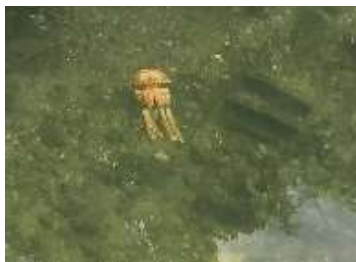
クラゲが泳いでいました

保護者や地域の皆さん、子供たちが水路へ下りるところを見かけたら、注意の声掛けをよろしくお願い致します。地域みんなの目で、子供たちや高齢者を見守っていきましょう。