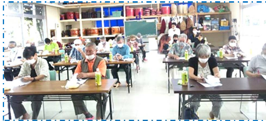
定期総会に参加し資料を熟読する会員の皆様(古謝公民館)

★予算や会務行事が決定 五月二十四日に定期総会が開催され、委任二百六八含む区民三十名が参加し慎重審議され、今年度予算他全ての審議事項が事務局提案通り可決成立しました▲今年度予算は六十九万七千と前年度より十九万九千円の増となり、繰越金が八十八万四千円となつていきます▲また、その他審議事項に、ホール照明施設改修や空調設備新設、並びに屋上放送設備改修など、沖縄市の補助金(工事費の七十%)を活用した、公民館設備改修事業が盛り込まれ承認を頂きました▲工事費の内三十%の自治会負担について、七月から九月まで各世帯(賛助会員含む)千円、合計三千円のご負担をお願いすることになりました▲出費多端であり誠に恐縮ですがご理解いただきご協力をお願いいたします。