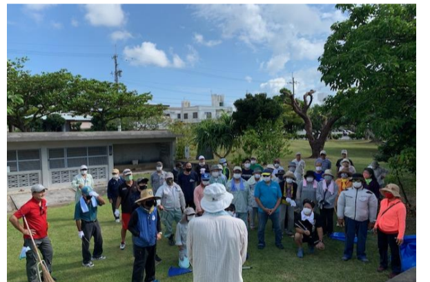
10月11日(日)午前10時から泡瀬復興期成会主催 拝所の清掃！泡瀬第三支部はカーヌ毛の清掃を行いました。60名の参加者があり今までにない大人数での清掃作業になりました。