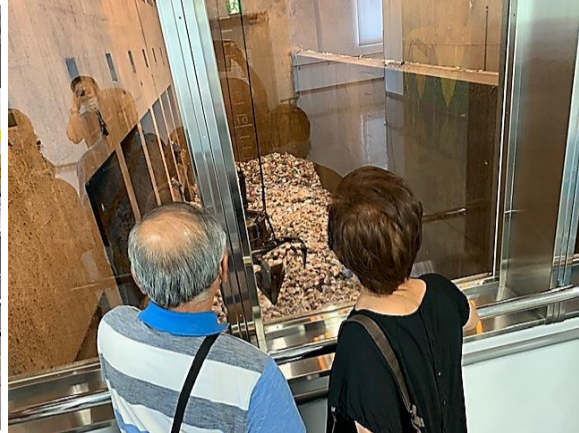
第2回 倉浜施設見学