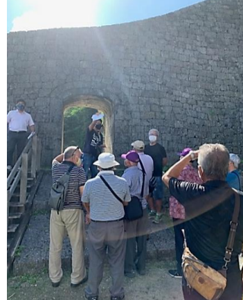
第3回 浦添グスク&ようどれ