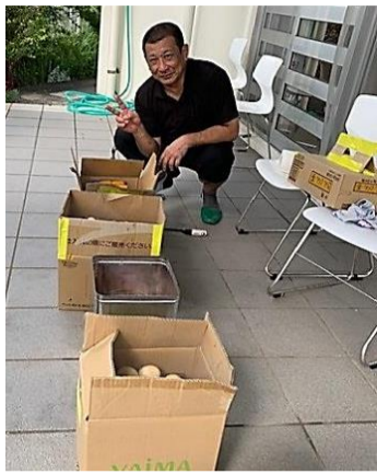
第1回 新里酒造見学&燻製講