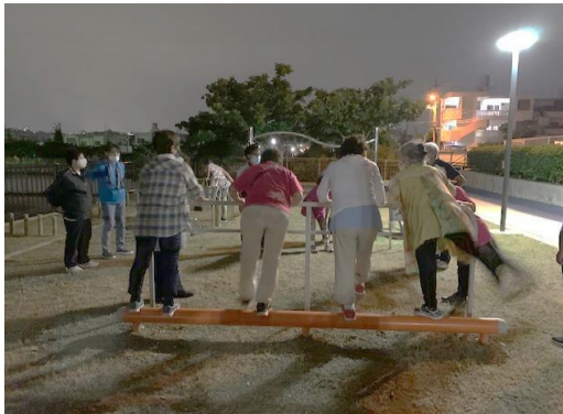
10/7公園器具で健康づくり講座