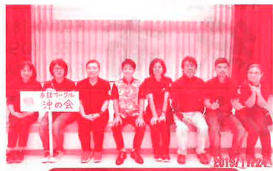
障がい者支援活動（手話）