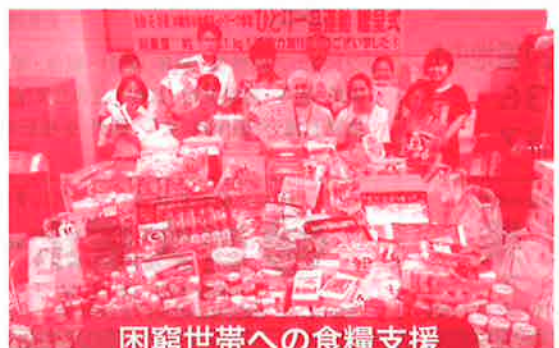
困窮世帯への食糧支援（フードバンク運動）