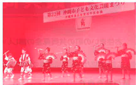
市内子どもの育成支援