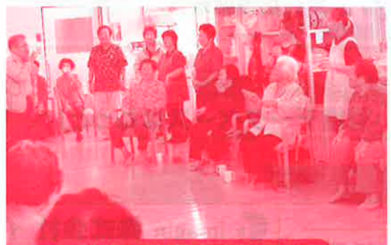
地域の高齢者支援活動