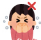
手で覆って咳をする(NG)