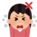
そのまま咳をする(NG)