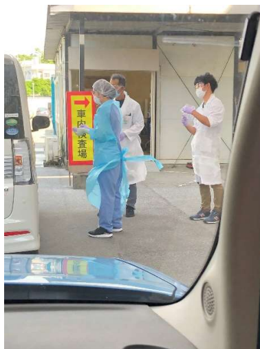
車内検査場の様子