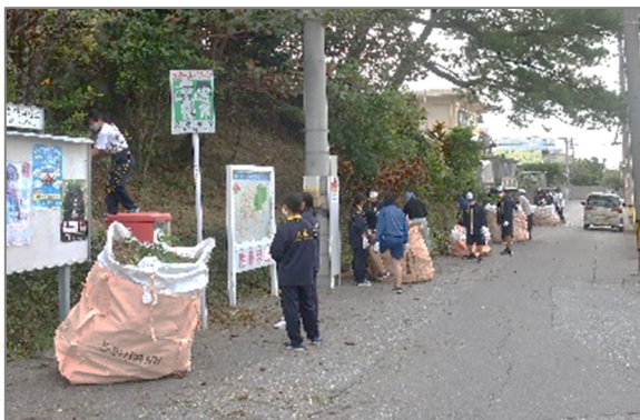
↑ 公民館周辺 ↓ あしびな～