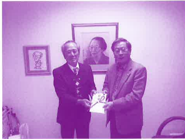
赤い羽根共同募金をいただきました (沖縄市老人クラブ連合会)