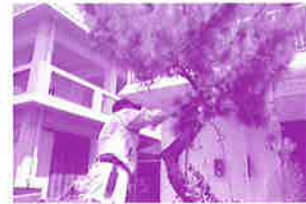
地域助け合い活動