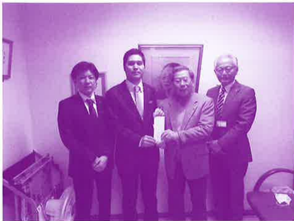
歳末たすけあいへ協力していただきました。 (コザ信用金庫労働組合)