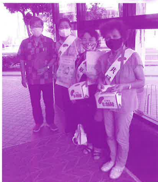
コープ山内店にて街頭募金に協力して頂きました (中の町婦人会)