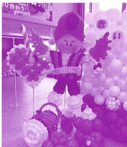
赤い羽根共同募金運動啓発のバルーンアート

令和2年10月1日より展開しております、『赤い羽根共同募金運動』および、12月1日より1か月間展開されました『歳末たすけあい運動』にご協力頂きました皆様へ、お礼を申し上げます。誠にありがとうございました。