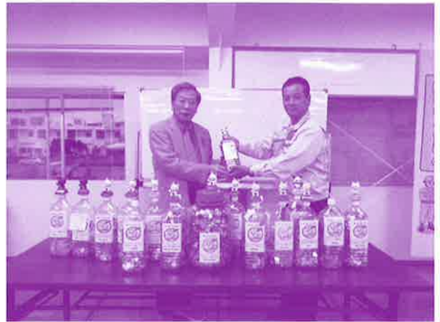
事業所に手作りの募金箱を設置し、職員へ募金を 呼び掛けて頂きました。(沖縄市管工事協同組合)