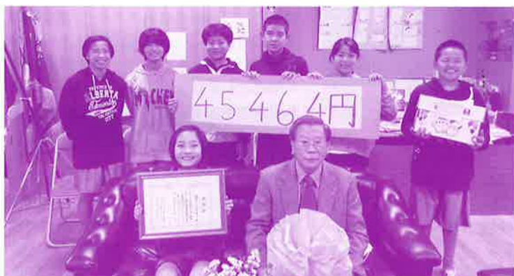
学童募金贈呈式の様子 (安慶田小学校)