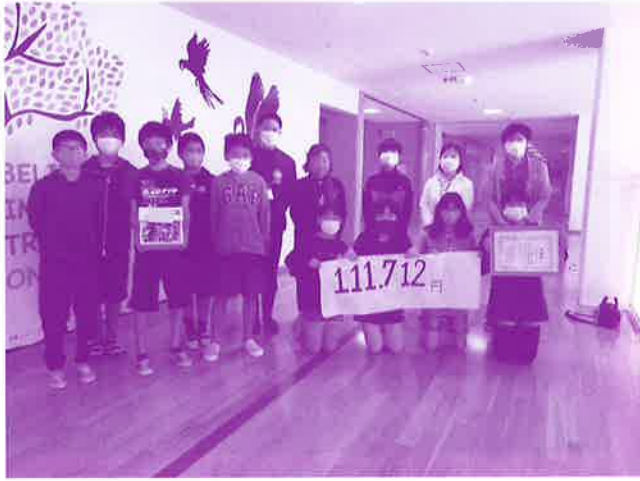
学童募金贈呈式の様子 (美東小学校)