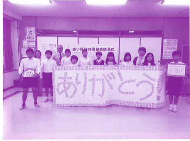
学童募金贈呈式の様子 (美原小学校)