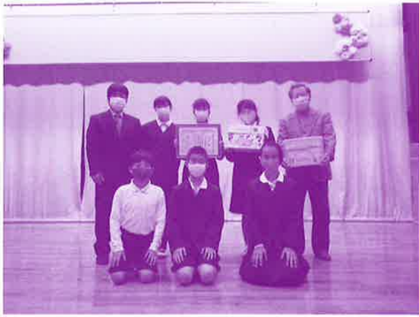
学童募金贈呈式の様子 (コザ小学校)