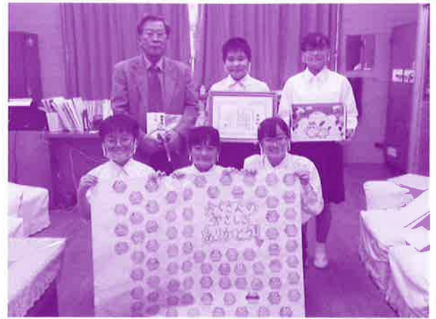
学童募金贈呈式の様子 (越来小学校)