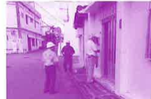
高齢者の見守り訪問活動