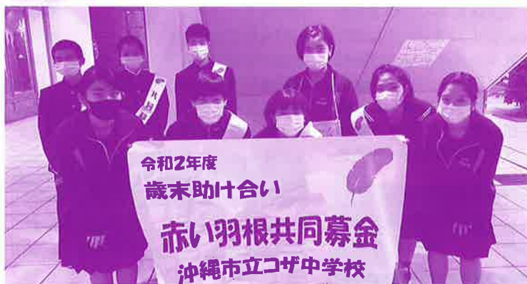
プラザハウスにて街頭募金に協力して頂きました (コザ中学校 ボランティア委員会)