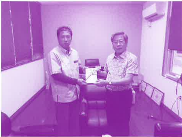
赤い羽根共同募金と歳末たすけあい募金をいただきました (有限会社海邦生コン工業)