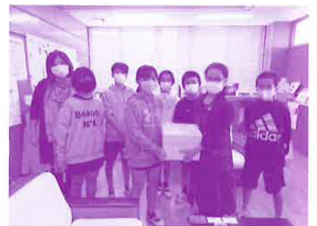
学童募金の様子 (室川小学校)