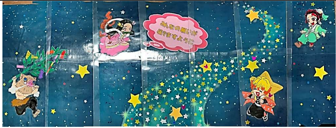
↑ ハレルヤ保育園の力作 鬼滅の刃の短冊