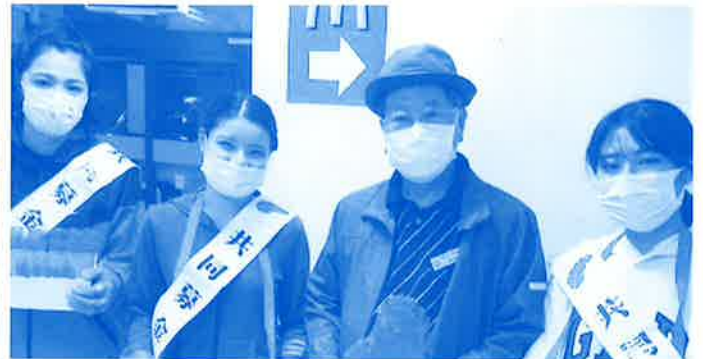
市内9カ所で街頭募金の活動を行って頂きました (沖縄市私立保育園連盟)