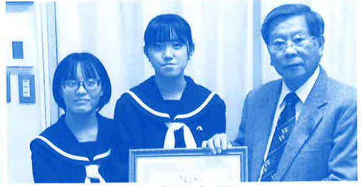
学童募金贈呈式の様子 (山内中学校)