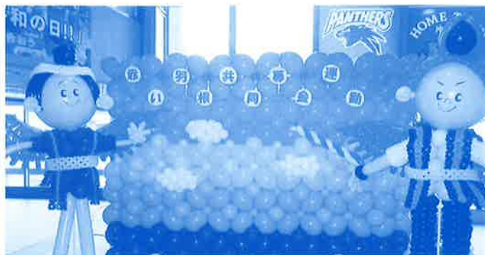
赤い羽根共同募金運動啓発パネル展にバルーンアート② (今年は、エイ坊と一緒にさーちゃんも登場しました!!)