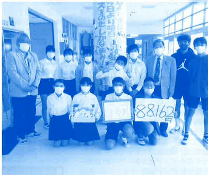
学童募金贈呈式の様子(泡瀬小学校)