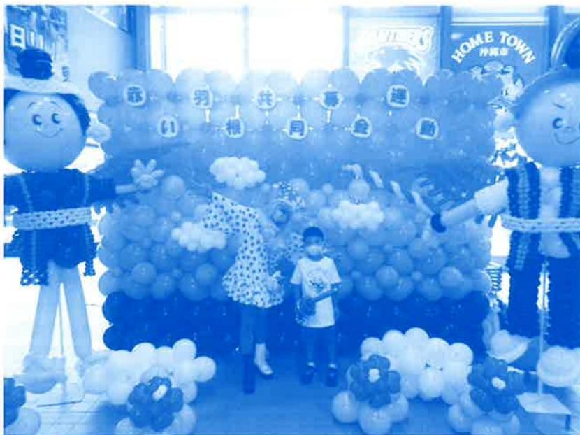
赤い羽根共同募金運動啓発パネル展にバルーンアート① (製作して頂いたピエロのファンキーさんと募金してくれた男の子)

令和3年度も、『赤い羽根共同募金運動(10/1～)』及び『歳末たすけあい募金運動(12/1～12/31)』が多くの皆様のご協力のもと実施されました。