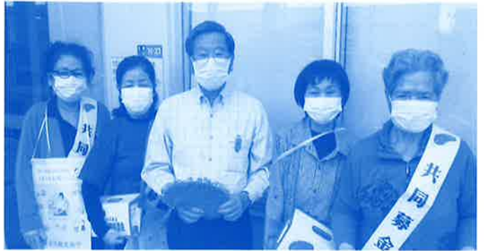
今年も各事業所に手作りの募金箱を設置し、職員さんへ歳末たすけあい募金を呼び掛けて頂きました。(沖縄市管工事協同組合)