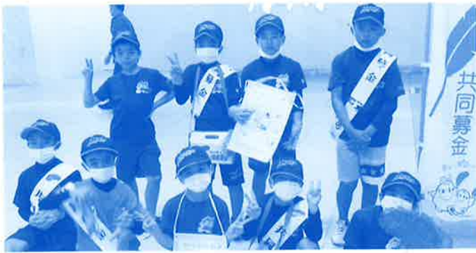
街頭募金の様子 イオン 沖縄ライカム (美原ドラゴンズの皆さん)