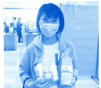
私保連さんへ街頭募金を行って頂いたお礼に、ボランティアさんの手作りタオルの贈呈 (お掃除タオルプロジェクト)

沖縄市私立保育園連盟 社会福祉法人 おきなわ長寿会おきなわ長寿苑 社会福祉法人 美さと福祉会美さと児童園