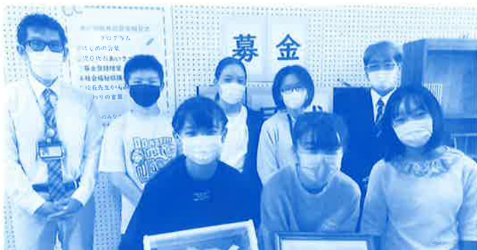
学童募金贈呈式の様子 (宮里小学校)