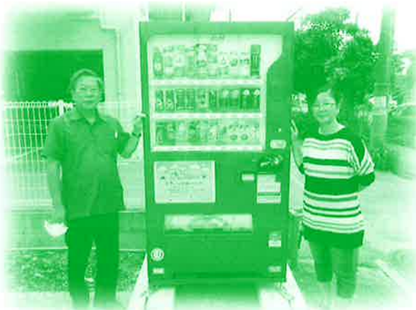
社会貢献型自動販売機 新規設置 (こども居場所団体 くじら寺子屋)