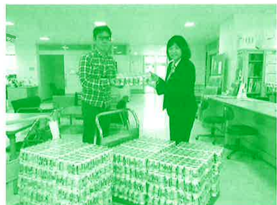
沖縄ヤクルト株式会社様より 市内のこども居場所団体さんへ