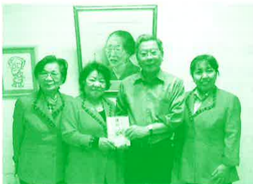
寄付金贈呈式 沖縄商工会議所 女性会様