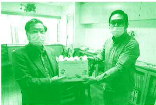
おそうじタオルプロジェクト 市内で活動する福祉団体さんなどへ