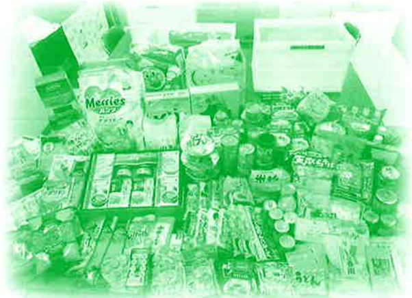
ひとり一品運動 フードバンク事業 (食料を募り、困っている世帯等へ配布)