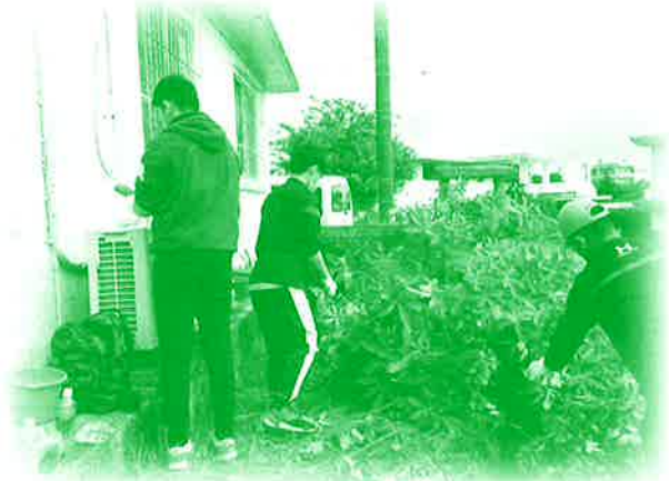
歳末助け合い草刈りボランティアの様子