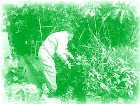
旧盆助け合い草刈りボランティアの様子