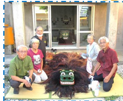
虫干しの神獅子加那志(御神屋)

旧暦の七月七日の七夕に、自治会役員や古謝獅子舞保存会の皆様も参加して、御神屋に奉納してある神獅子加那志の虫干しを行いました▼神獅子加那志は令和二年三月に新調された今年二年目となりますが、獅子の保存状態の確認と神酒でのお清め、次週のお道ジュネーの打ち合わせが主な目的となり、新型コロナウイルスの感染拡大が三年目を迎える、未だに終息が見えないコロナ禍での開催となりますが、自治会の神事として、伝統を受け継ぎ可能な限り継承していくべきですので、皆様のご理解を宜しくお願いいたします