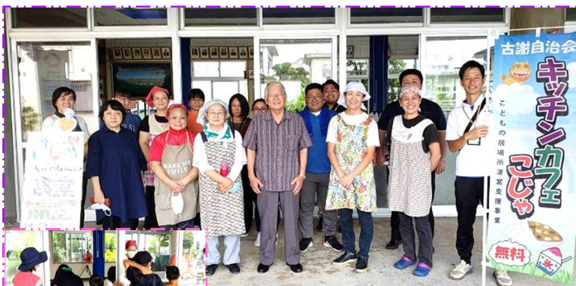
←カレーライスを受け取る子ども達 ↑スタッフの皆様(古謝公民館)