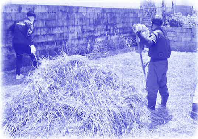
草刈りボランティア