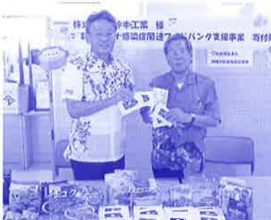
株式会社 仲本工業様 コロナ関連フードバンク事業へ寄付及び 食料品寄贈