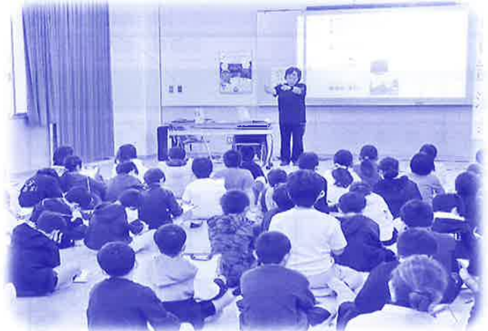
小学校にて福祉講演会