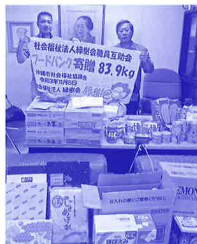
社会福祉法人 緑樹会職員互助会 職員の皆さんから募って頂いた 食料品を寄贈