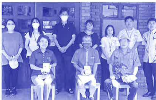
味自満チェーン 夏休み応援弁当 無償配布