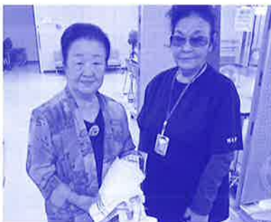
なでしこの会 使い古したタオルを お掃除タオルへ リメイクし寄贈