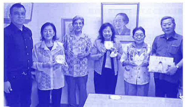
音訳・ボランティアブーゲンビリア 『音訳CD・絵本』贈呈