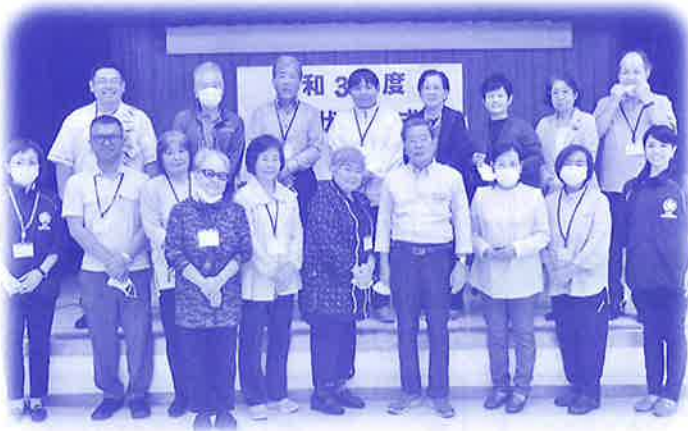
市民後見・法人後見サポーター養成講座修了式