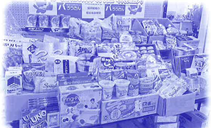
フードバンク（ひとり一品運動）