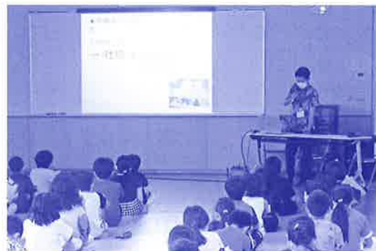
福祉講座 ボランティアについて