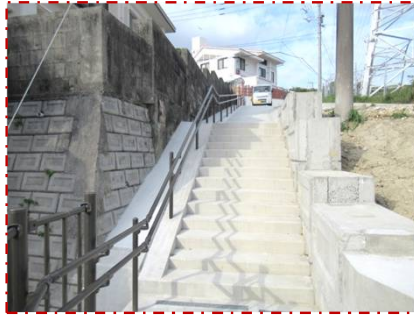
終点付近階段工と手すりの避難通路

令和5年2月下旬に完成した、古謝自治会だより 標高差二十メートル 令和5年2月下旬に完成した、古謝自治会だより スズメ横の里道が、沖縄市道路課の災害時緊急避難通路整備事業により、この度整備竣工致しました。地震時の津波来襲の脅威から東部地域を守るため、古謝地区ではインシペラに続き二本目の避難通路整備となりました。▼全長は約百五十メートル、入口の市道大里メートルの標高が海抜約十六メートル、終点の市道古謝1号線で高江洲木工所付近の標高は約三十六メートル、標高差が二十メートル、幅員約二メートル、コンクリート階段工や斜路、手すり等が整備されました。▼その後、防災訓練等で避難通路を確認しようと計画していましたが、区民の皆様一度だけ散歩がてら現場をご確認いただければと思います。