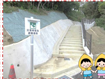
GENテニススクール横の避難通路