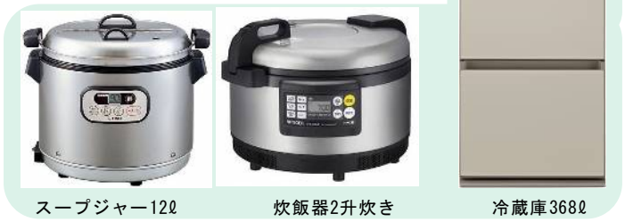
スーブジャー12ℓ 炊飯器2升炊き 冷蔵庫368ℓ

古謝自治会が所属している沖縄市自治会長協議会では、令和5年度の新しい自治会会員章を作成し4月以降各世帯に配布いたします。▼会員とは、古謝自治会区域内に居住し自治会に会員登録を行っている世帯をいい、総会において会員は各々一票の表決権を有し、区域内の事業所を賛助会員としています。▼令和4年4月現在、会員数は447世帯で、令和5年1月現在の会員加入率は20.9%となり、賛助会員数は77社となっています。▼会員の皆様にご負担頂いている自治会費は自治会活動を支援する貴重な財源となっていますので、今後とも会員の皆様のご理解とご協力をよろしくお願いいたします。▼未加入の世帯様は、早めに会員登録を行って下さい。