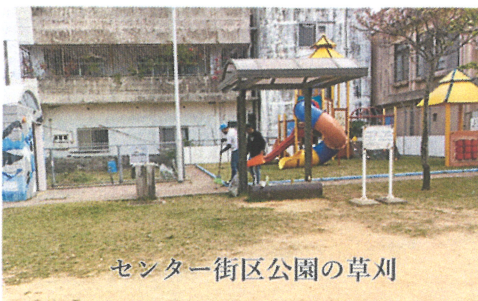
センター街区公園の草刈