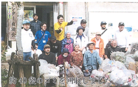
約40袋のゴミを回収しました