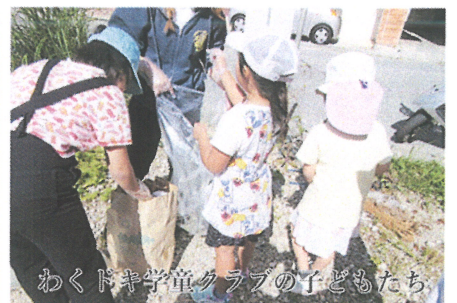
わくドキ学童クラブの子どもたち