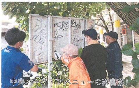
中央パークアベニューの落書落し