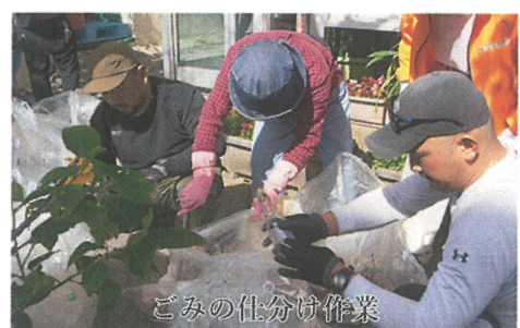
ごみの仕分け作業