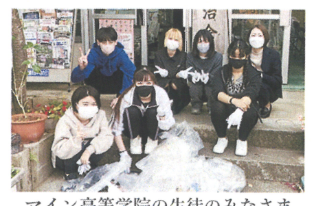
マイン高等学院の生徒のみなさま