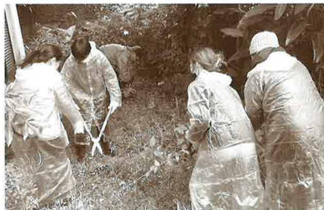
歳末たすけあい 清掃ボランティア (13世帯にて実施。気持ち良く新年を迎える準備が出来ました)