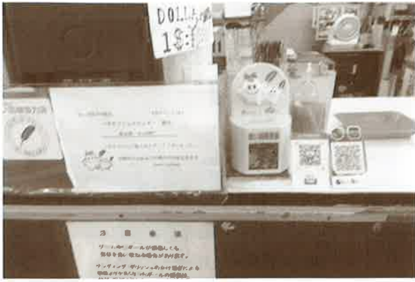
市内 24 カ所で募金箱の設置にご協力を頂いています。 (コザボウリングセンター)