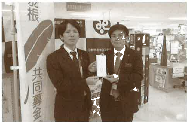
歳末たすけあい 職域募金へ コザ信用金庫労働組合の皆さま