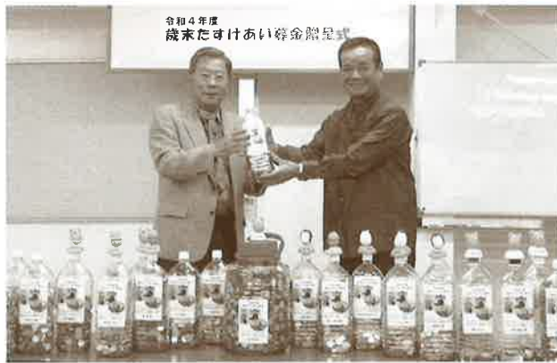
歳末たすけあい募金へ 手作りの募金箱を各事業所へ設置して頂きました。 (沖縄市管工事協同組合 協力事業所 26カ所)