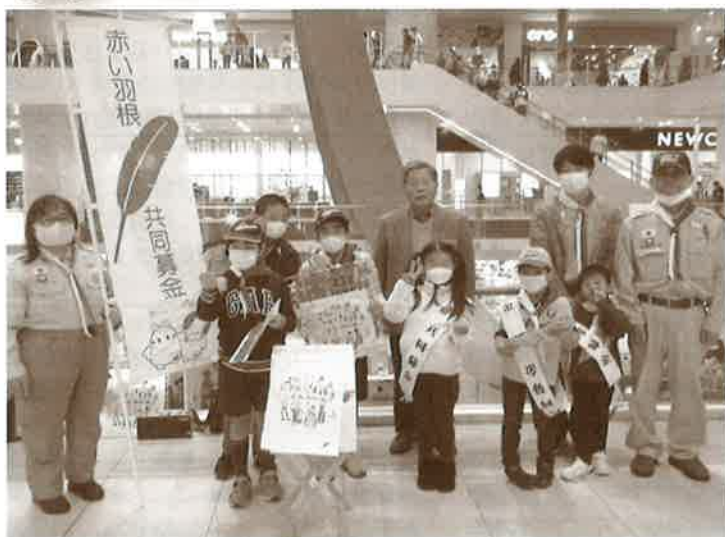
街頭募金 ボーイスカウト沖縄県連盟 沖縄第1団の皆さん (活動団体、協力店舗、募金してくださったお客様方、ありがとうございました!)