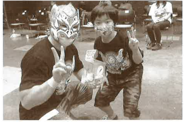
社会福祉チャリティー大会にて募金箱のご協力を頂きました！ (琉球ドラゴンプロレスリング)