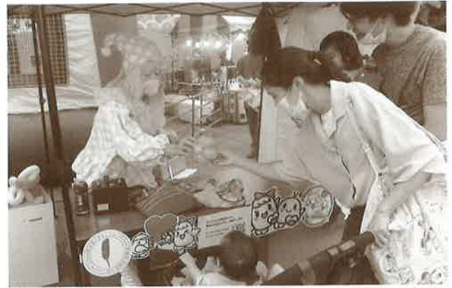
ピエロのファンキーさんより募金者の方へバルーンのプレゼント☆