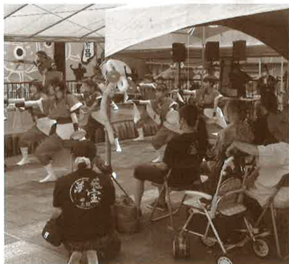
2022ボランティアまつりin銀天街 (市内のボランティア団体による出店やステージ。多くの皆さんが遊びに来てくれました!)