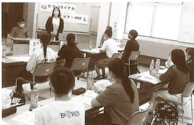
市内の高校生の皆さんが福祉体験学習に参加しました！ (スマートライアルツアー)