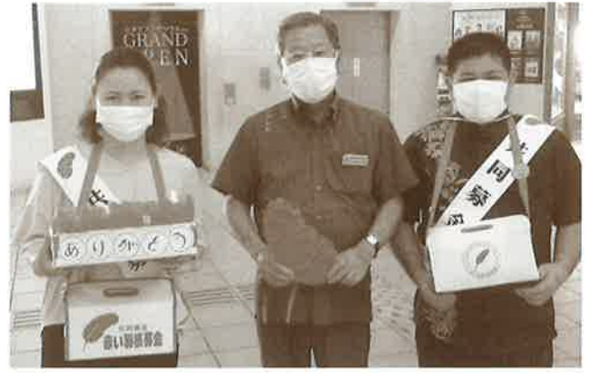
街頭募金 ご協力ありがとうございました！