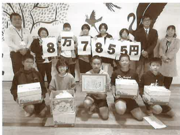
学童募金贈呈式 美東小学校 (市内の小・中学校の児童生徒の皆さんから思いやりの心とともに募金が届きました)

令和4年度も『赤い羽根共同募金運動 (10/1 ~)』、『歳末たすけあい募金運動 (12/1 ~ 12/31)』が多くの皆様のご協力のもと実施されました。今年度集まった『赤い羽根共同募金』は、令和5年度において、沖縄市の地域福祉事業費としてや、県内の地域福祉活動団体の活動費として活用されます。 また、『歳末たすけあい募金』は、「みんなでささえあうあったかい地域づくり」をキャッチフレーズに展開され、集まった募金は、沖縄市内において生活に困っている世帯や緊急かつ一時的に支援が必要な世帯などの支援に活用されます。 今号では、今年度の沖縄市共同募金委員会の募金実績 (3/7 現在) のご報告と『赤い羽根共同募金』『歳末たすけあい募金』『災害義援金』にご協力頂きました皆さまのご紹介をさせて頂きました。