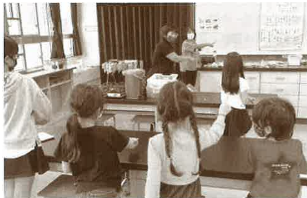
手話の普及活動にも募金が活用されています。 (手の会 手話サークル)